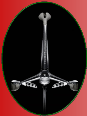
Répartition du poids entre la selle et le guidon