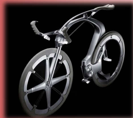
B1K, concept de vélo, Peugeot